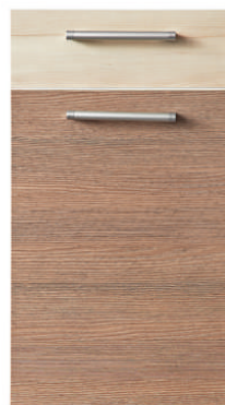
Modrzew z Gruszą