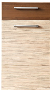
Trawa z Orzechem