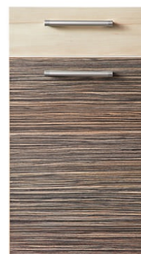
Zebrano BS z Gruszą