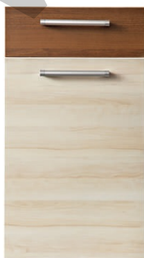
Grusza z Orzechem